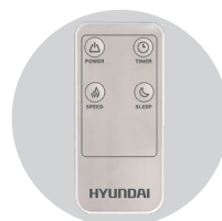
Для удобства эксплуатации пульт управления в комплекте

Ручка для переноски и установки резервуара