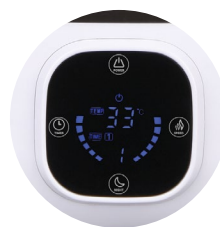
Сенсорная панель управления I-Touch