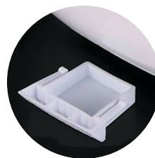
Встроенная аромакапсула для ароматического масла