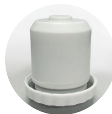
Минеральный фильтр в комплекте